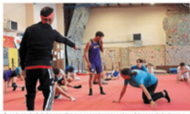
Avec le souhait de transmettre ses connaissances et expériences de la danse au