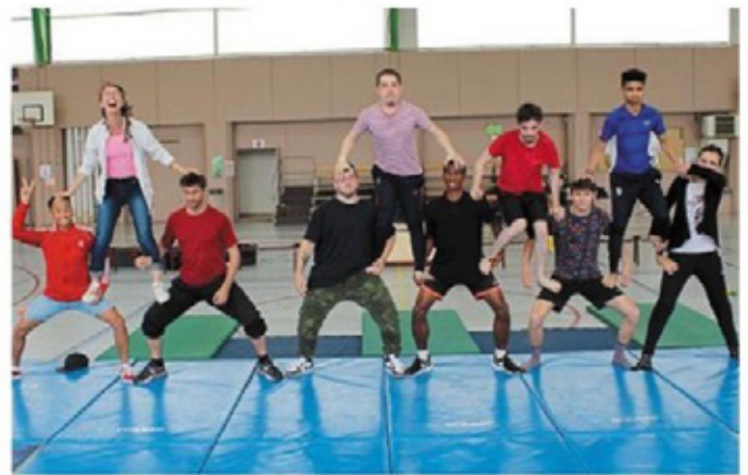
Stagiaires, éducateurs et accompagnants. La semaine de stage s'est terminée le 9 juillet par un spectacle.