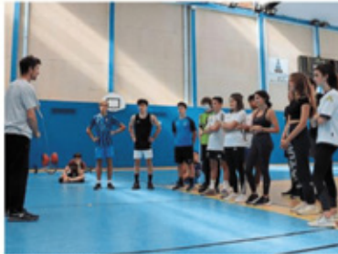
Parmi les activités présentées aux élèves du lycée Rabelais, le diabolo, instrument de jonglage.

Quelques jours plus tôt, déjà, ces artistes réunis dans la compagnie Croche, avaient présenté quelques extraits de leur futur spectacle dans l'enceinte du lycée François-Rabelais, dans le cadre d'une résidence d'artistes.