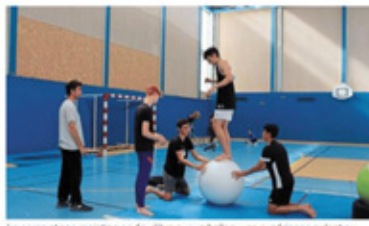
Le corps et son maintien en équilibre sur un ballon, une expérience qu'ont pu