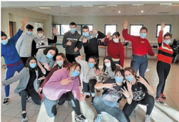
Atelier cirque pour la classe de 4 e Service aux personnes et aux territoires (Sapat).

La Maison familiale rurale (MFR) de Vouvant a tissé un partenariat avec la compagnie Croche, il y a deux ans, à l'occasion d'un projet avec l'association ArMuLeTe. Ainsi, lors de la résidence de création pour leur prochain spectacle, les artistes ont été hébergés à la MFR. Cela a permis des échanges entre jeunes et professionnels ainsi que des ateliers d'initiations diverses animés en veillées pour quelques classes.